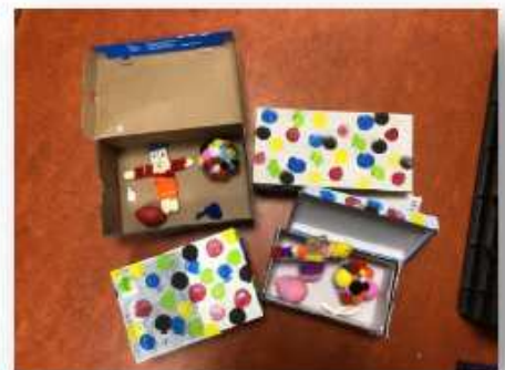
Parcours « Mon corps, mes émotions »