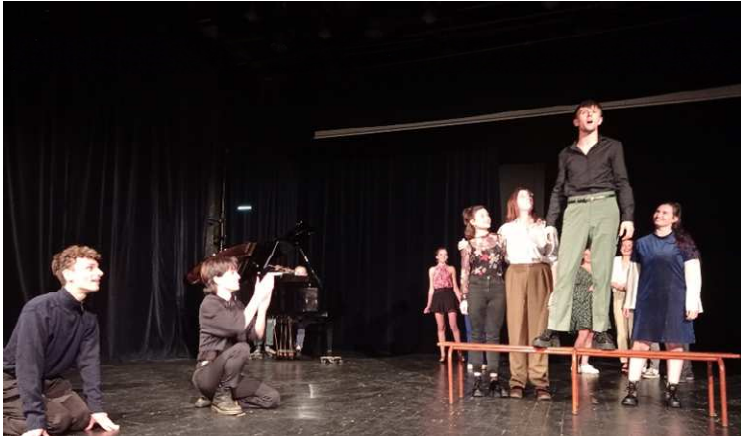
Représentation de l'ASTA lors de l'accueil des nouveaux habitants

A noter aussi, la rencontre des élèves d'écoles élémentaires avec les étudiants et le directeur de l'académie supérieure de théâtre d'Anjou sur leurs parcours, le métier de comédien, de metteur en scène, de régisseur.