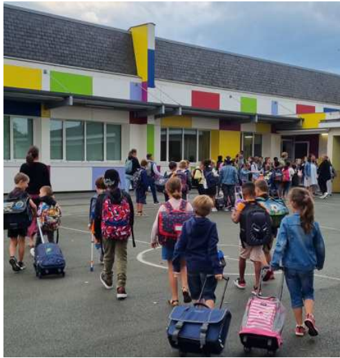
Rentrée scolaire 2022 à l'école R.Daguerre