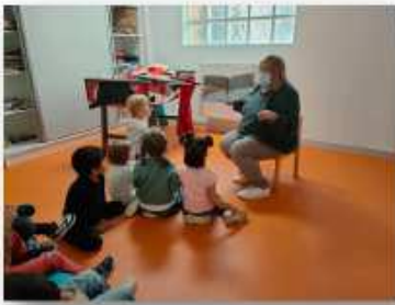
Parcours « il était une fois »

« C'est trop bien de pouvoir sortir de l'école ! »