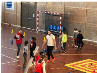
Stade de la Goducière - Semaine de l'Olympisme - Du 4 au 8 avril 2022

22 associations et 18 disciplines disponibles