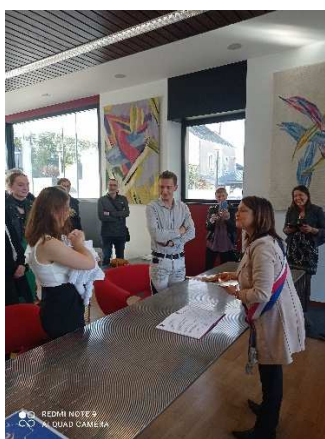
Parrainage civil en Mairie

L'éducation à la citoyenneté nécessite la responsabilisation des jeunes, dès leur plus jeune âge , et se fonde sur l'apprentissage du débat et de l'échange, de la confrontation des idées et des points de vue et du partage de la parole. Pour cela, nous proposons de décliner cet axe en 3 objectifs illustrés par plusieurs actions.