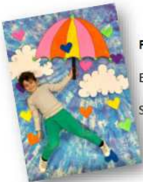
Parcours « ARC EN CIEL »